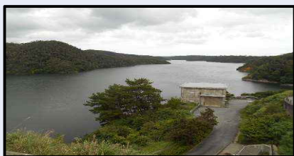
福地ダムの様子(参考: R1.6.21 100%記録時)