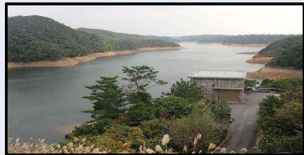
福地ダムの様子(12/31 14時)